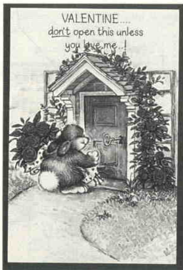
„My love to you on Valentine’s Day“

Die Autorin zeigt, wie Schüler und Schülerinnen im Anfangsunterricht auf Englisch miteinander singen, basteln, schreiben und spielen können.